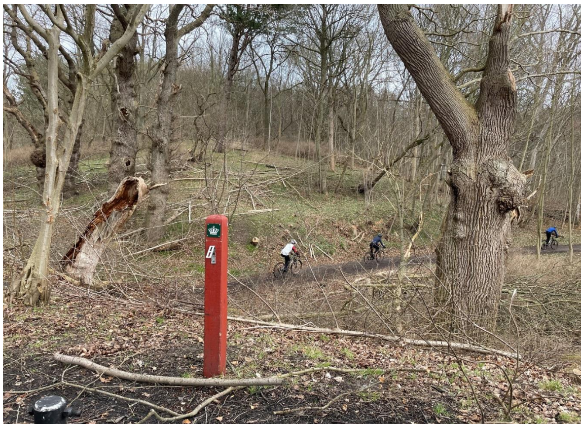
Fra Åbningsturen.