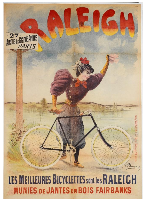
Plakat fra 1895: Clouet, E. Musée Carnavalet, Histoire de Paris

At være Flere i Selskab paa en saadan Tur kan naturligvis være en stor Behagelighed; men det er da en Nødvendighed, at