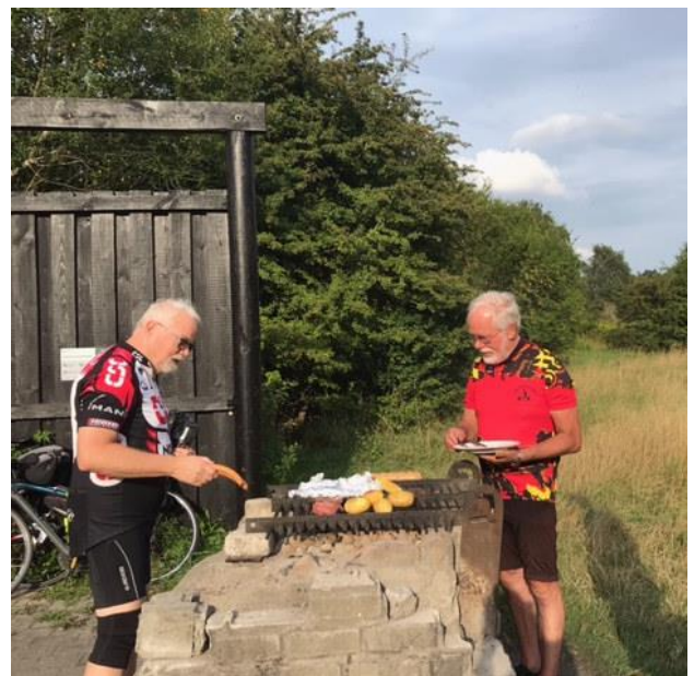
Fra et grillmøde i 2021.

Grillen er varm fra kl. 18.00. Alle medbringer selv grillmad og drikkevarer. Arrangementet gennemføres uanset vejret. Der er et stort madpakkehus, hvor man kan sidde og nyde den lune sommeraften selv om det regner. Ved udsigt til regn tændes der op i engangsgriller i kanten af huset.