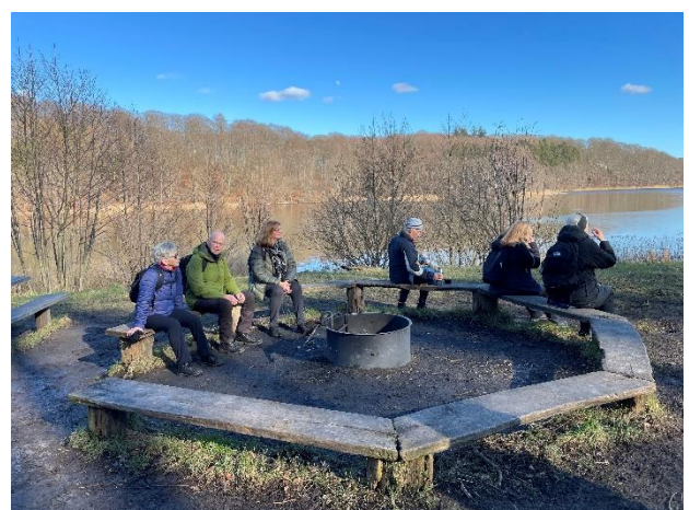
Fra vandreturen i marts, udsigt over Bagsværd Sø.

Hvis kræfterne er til det, kører vi til Bastrup Sø og videre hjem over Ganløse.