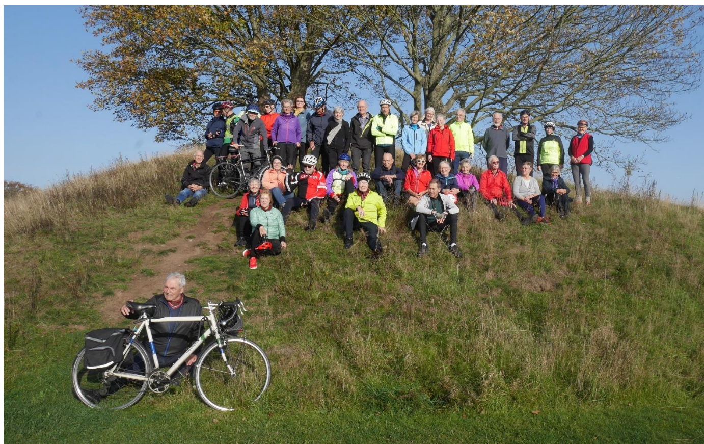
Lukketur: Turcyklistere på Kong Svends Høj.