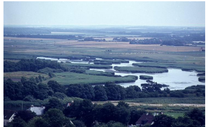
Marsken ved Ribe.