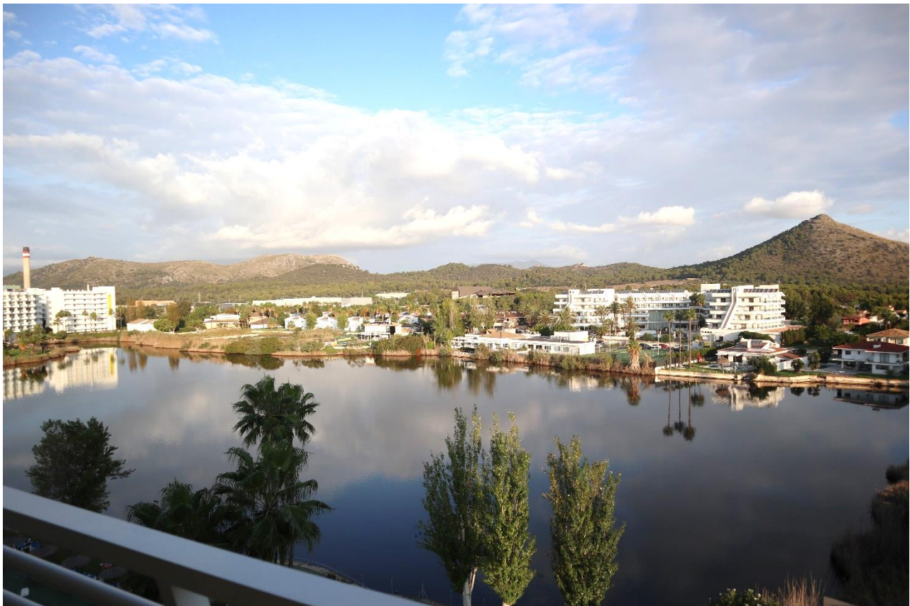
Vores udsigt fra hotellet.