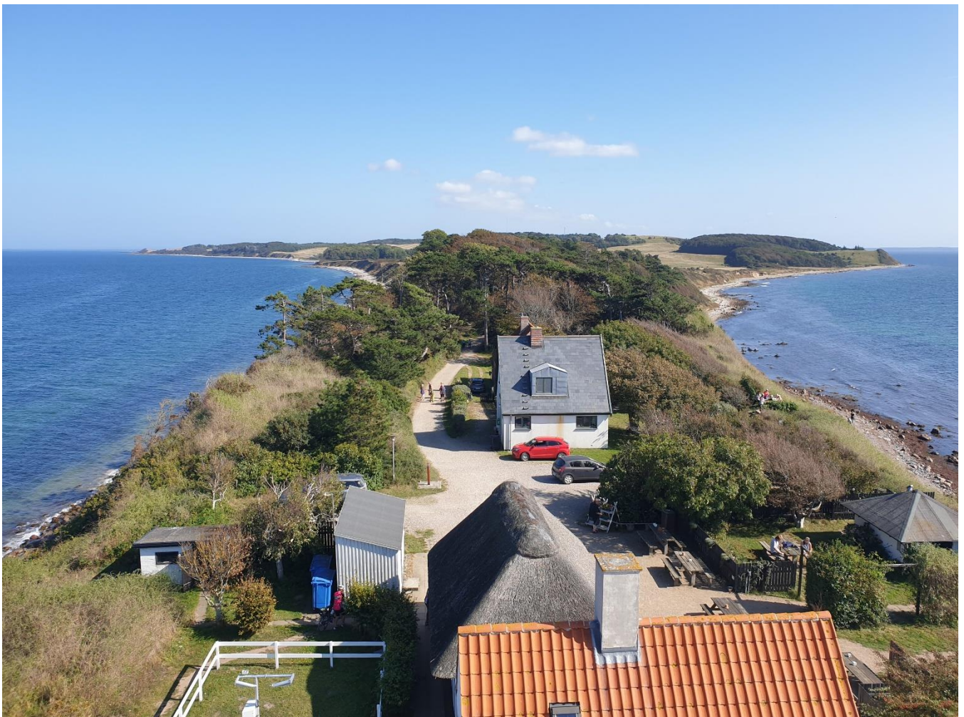
Fra Kalundborgturen, udsigten fra fyrtårnet på Røsnæs.