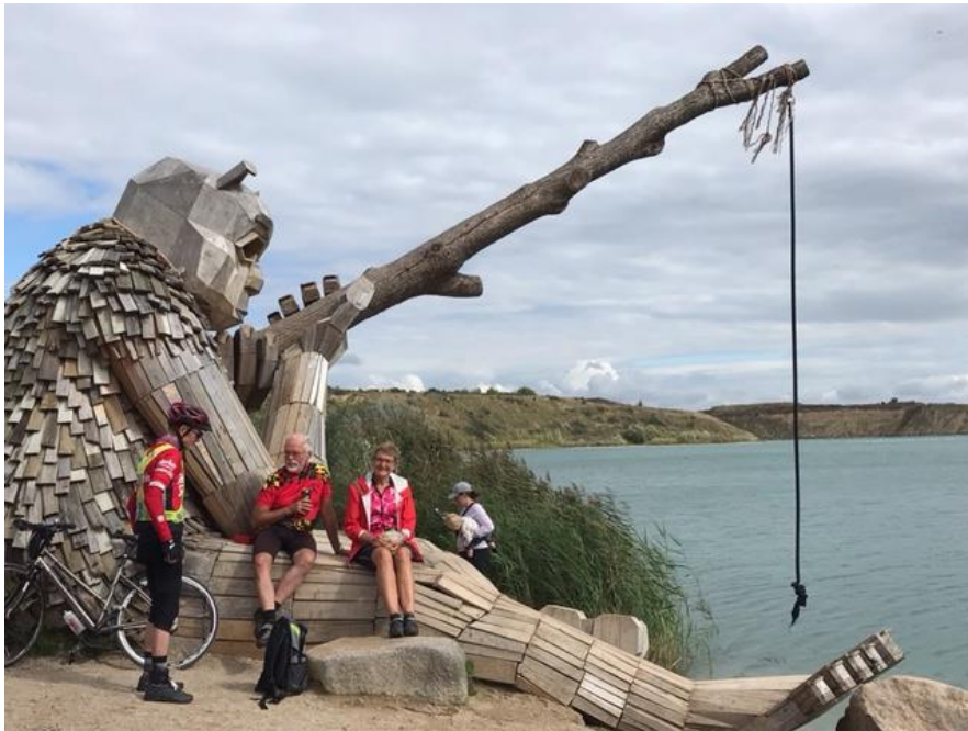
Runde Rie ved Lynghøjsøerne. Fra turen til Svogerslev i september.