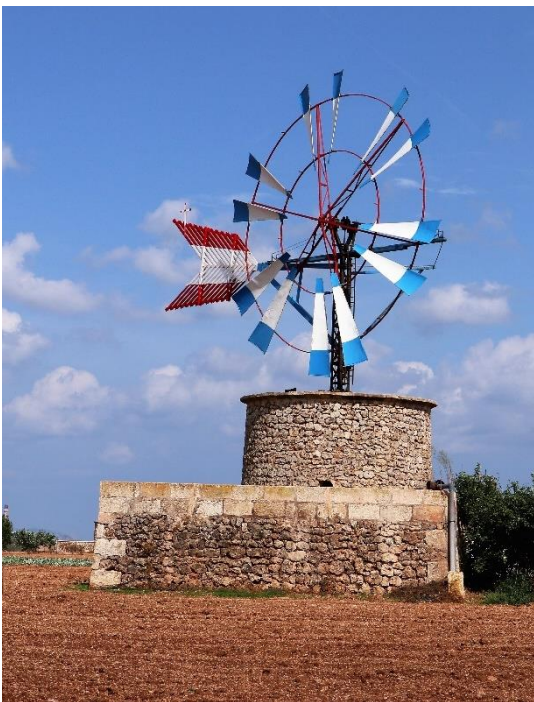
Mallorcinsk vindmølle.

På ruten så jeg en del af de traditionelle mallorcinske vindmøller. Nogle få var restaurerede med nye vinger, og en enkelt kørte endda fint rundt. Det var interessant at se dem dér ude på landet i deres naturlige miljø. Vindmøllerne på Mallorca er pumpemøller, som pumper vand op til vanding af afgrøderne. Ofte er møllen bygget op af et vandreservoir. Turen blev på 75 km med godt 500 højdemeter, det halve af Lluc-holdets klatretur.