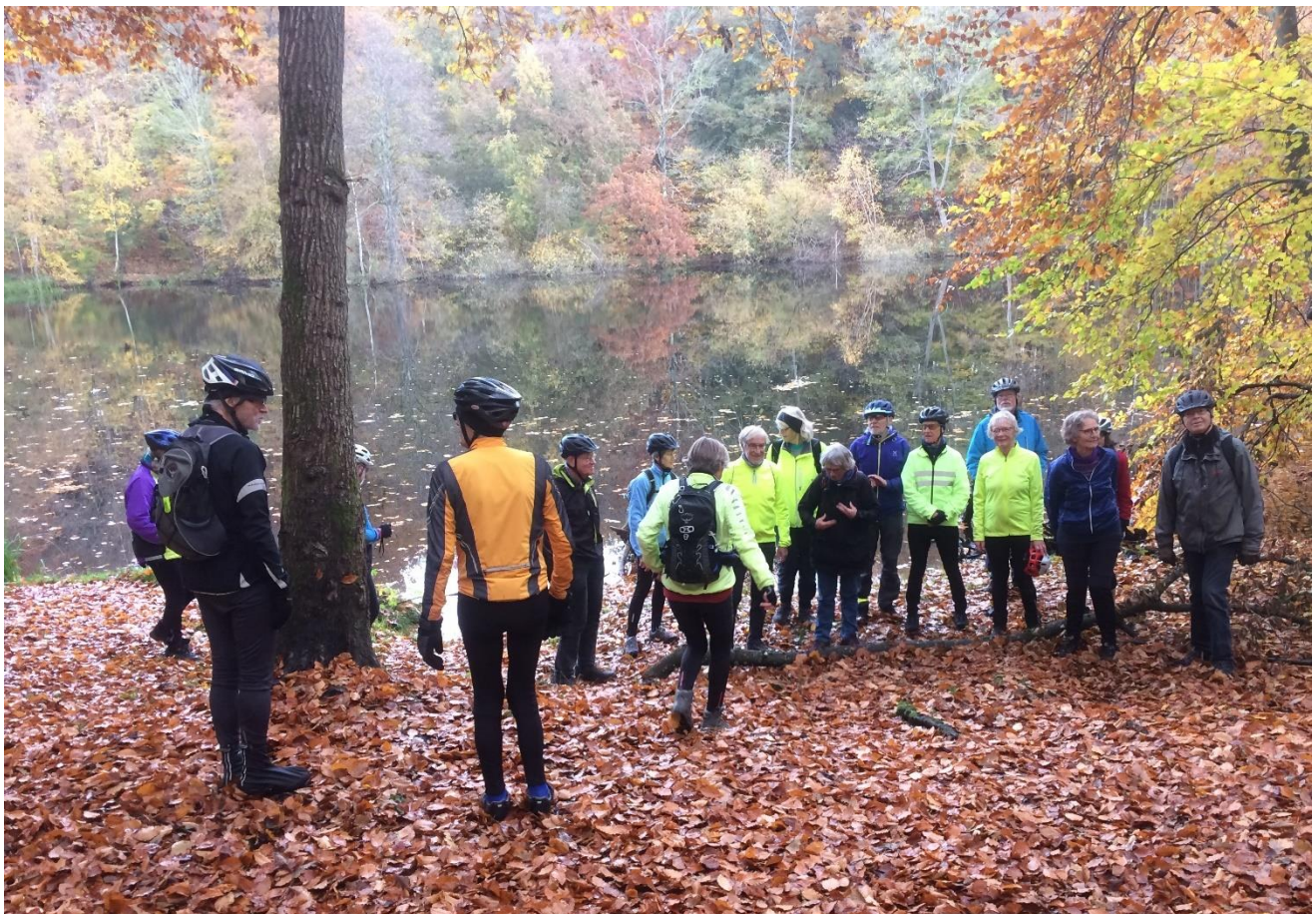
Lukketuren: Udsigten over Gulbjerg Mose.