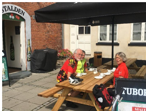
Kaffen indtages.

Og så blev det såmænd atter tørvejr, da vi fortsatte mod Rågeleje, Blistrup og Græsted.