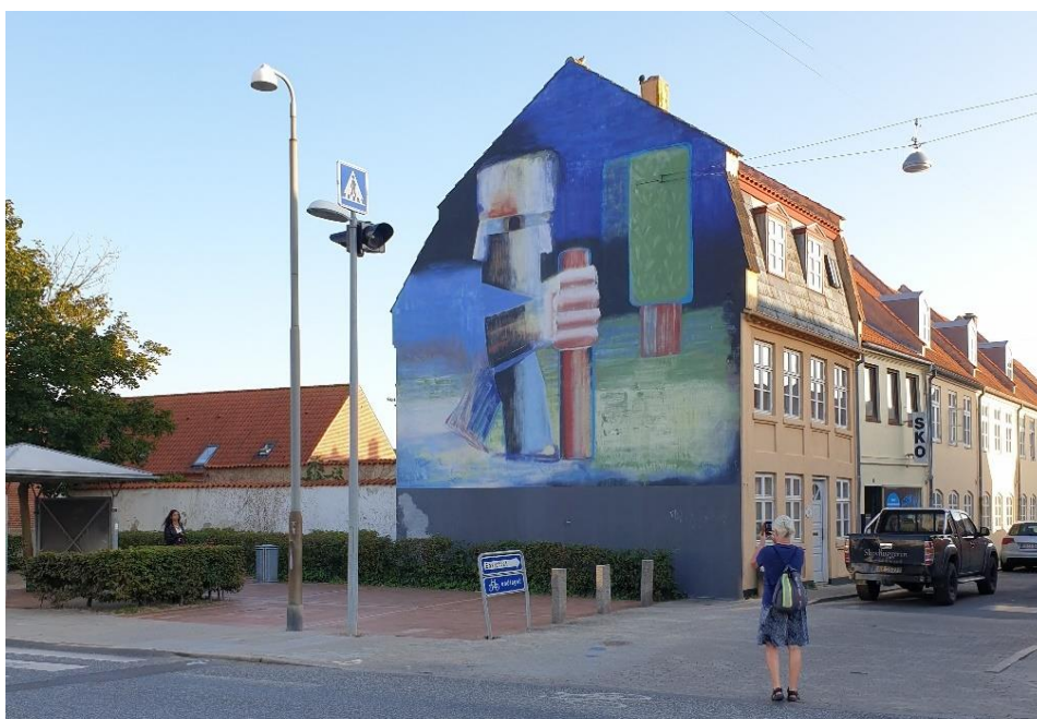
Turcyklist fotografierer i Kalundborg.