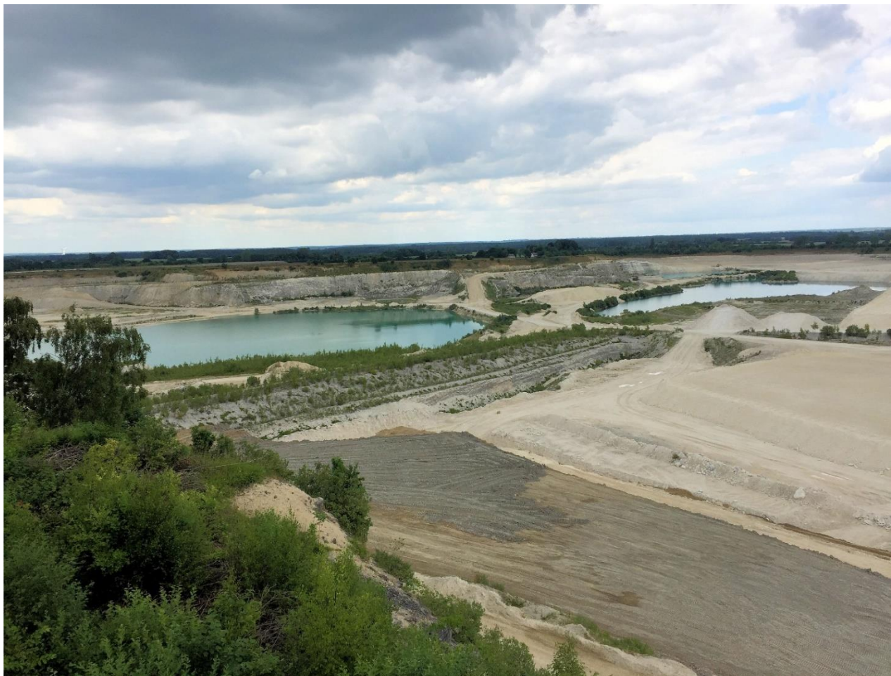
Fra St. Heddingeturen: Faxe Kalkbrud.