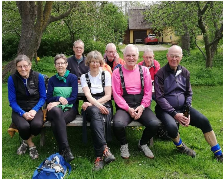
Fra klubfrokosten i maj.