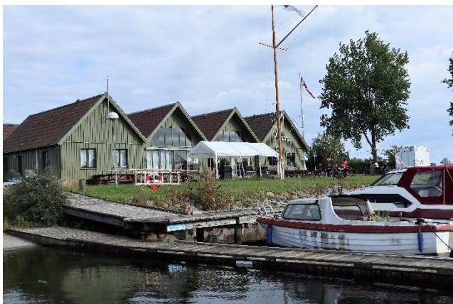
Greve Marina med Cafe Mågen