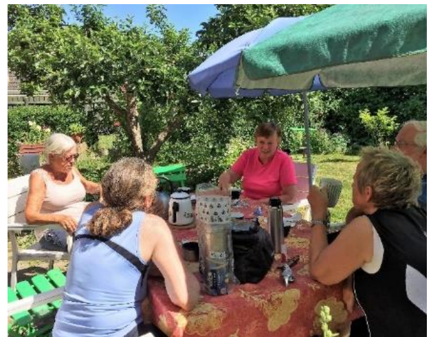
Lones have.

Som vi sidder i Lones hyggelige, solrige kolonihave med kaffe og isvafler, kan vi syv seje cyklister se tilbage på tre dejlige dage med skønne oplevelser, god stemning og herligt vejr til overflod.