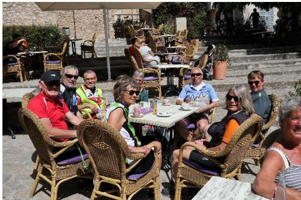
Torvet i Pollença 2019

og din højde. Frist for at være med i den samlede bestilling er 1. september.