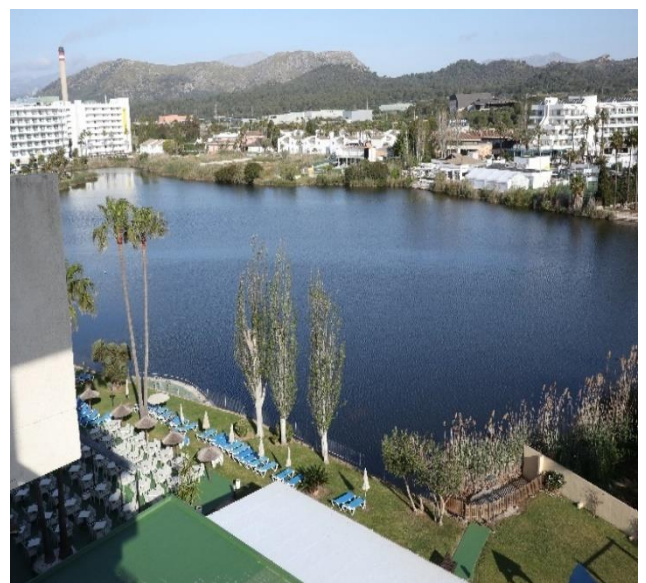
Udsigten fra vores hotel på Mallorca

Vi ankommer til hotellet sent om aftenen. Vi vil derfor starte vores cykling