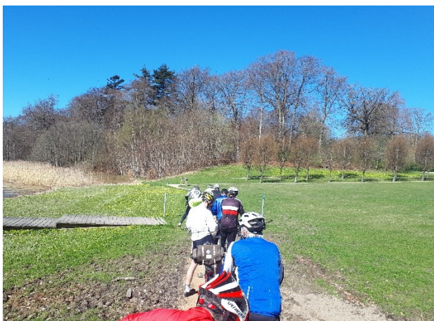
Fra Furesøturen 2018