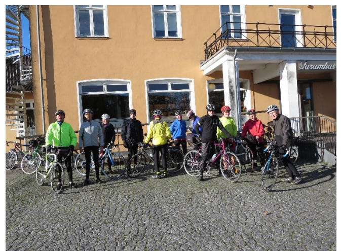
Fra Engsturen 2015