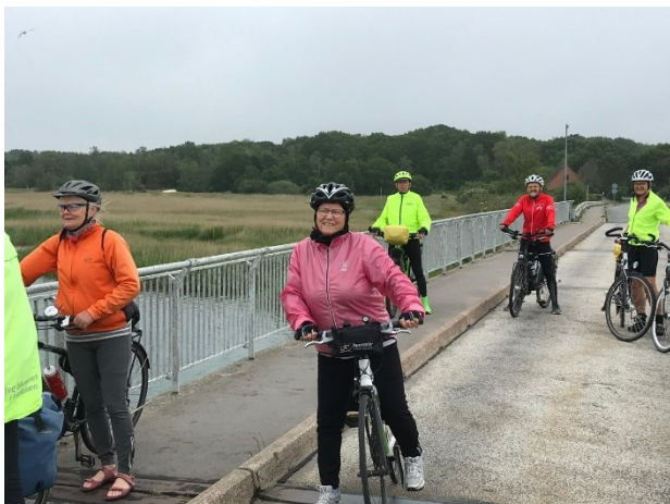
Fra turen i foråret 2020.