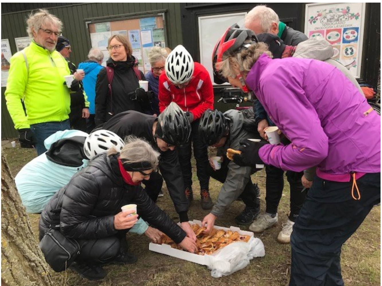
Kaffe og wienerbasser indtages.