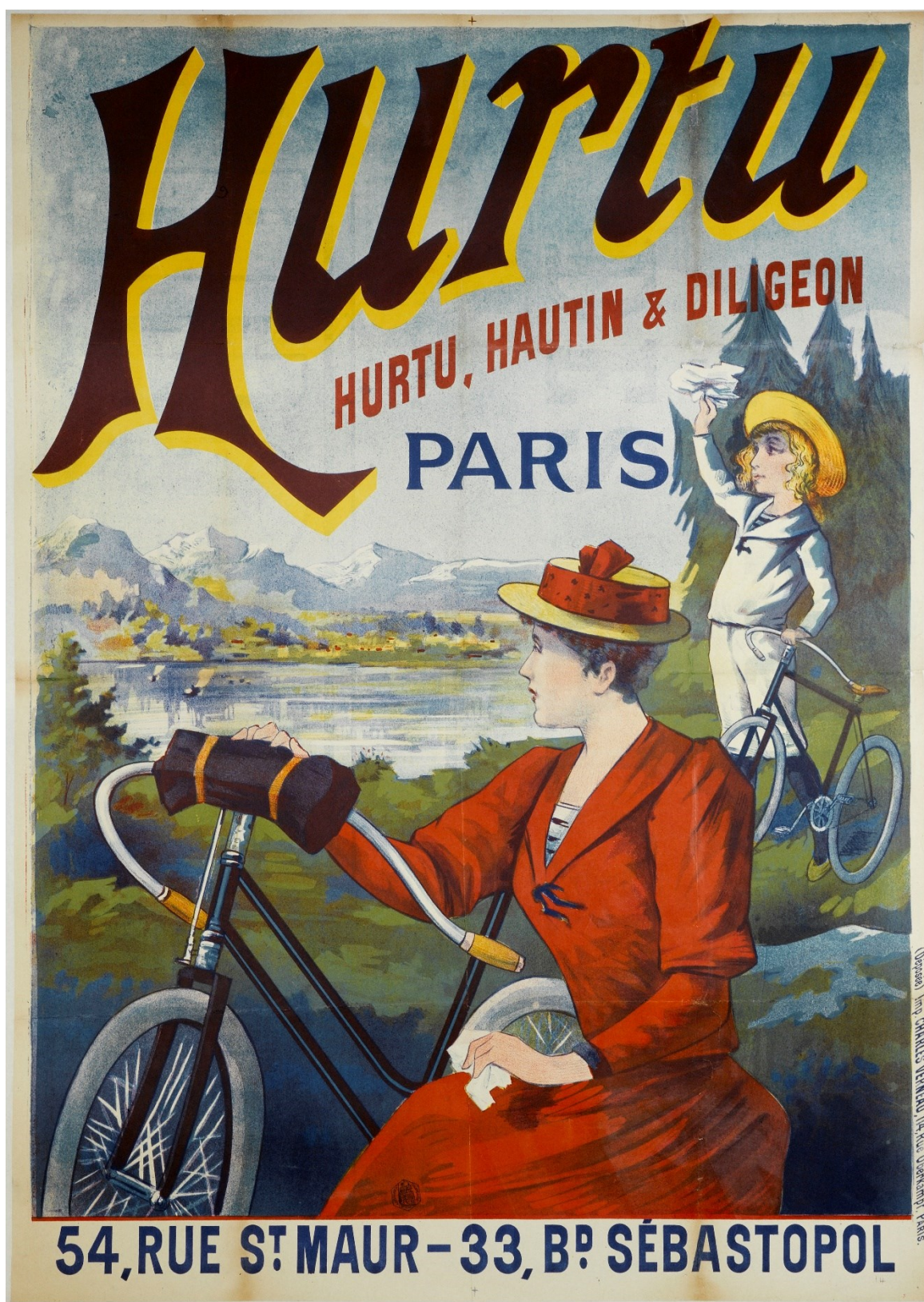
Plakat fra ca. 1890. Musée Carnavalet, Histoire de Paris.