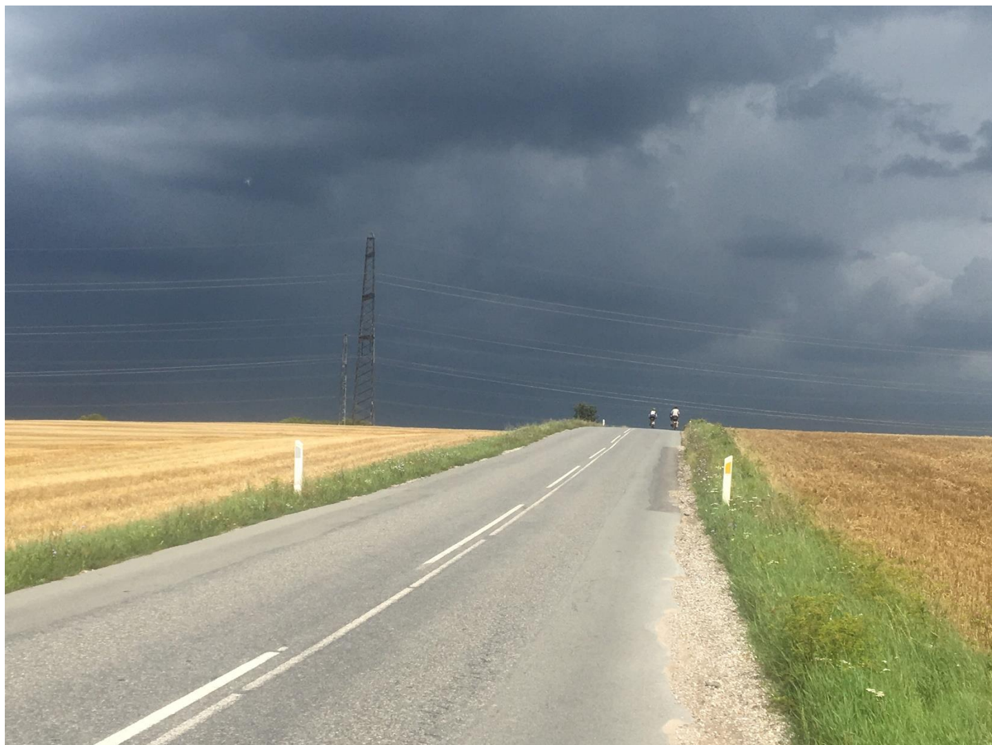
Hornsherredtur i august