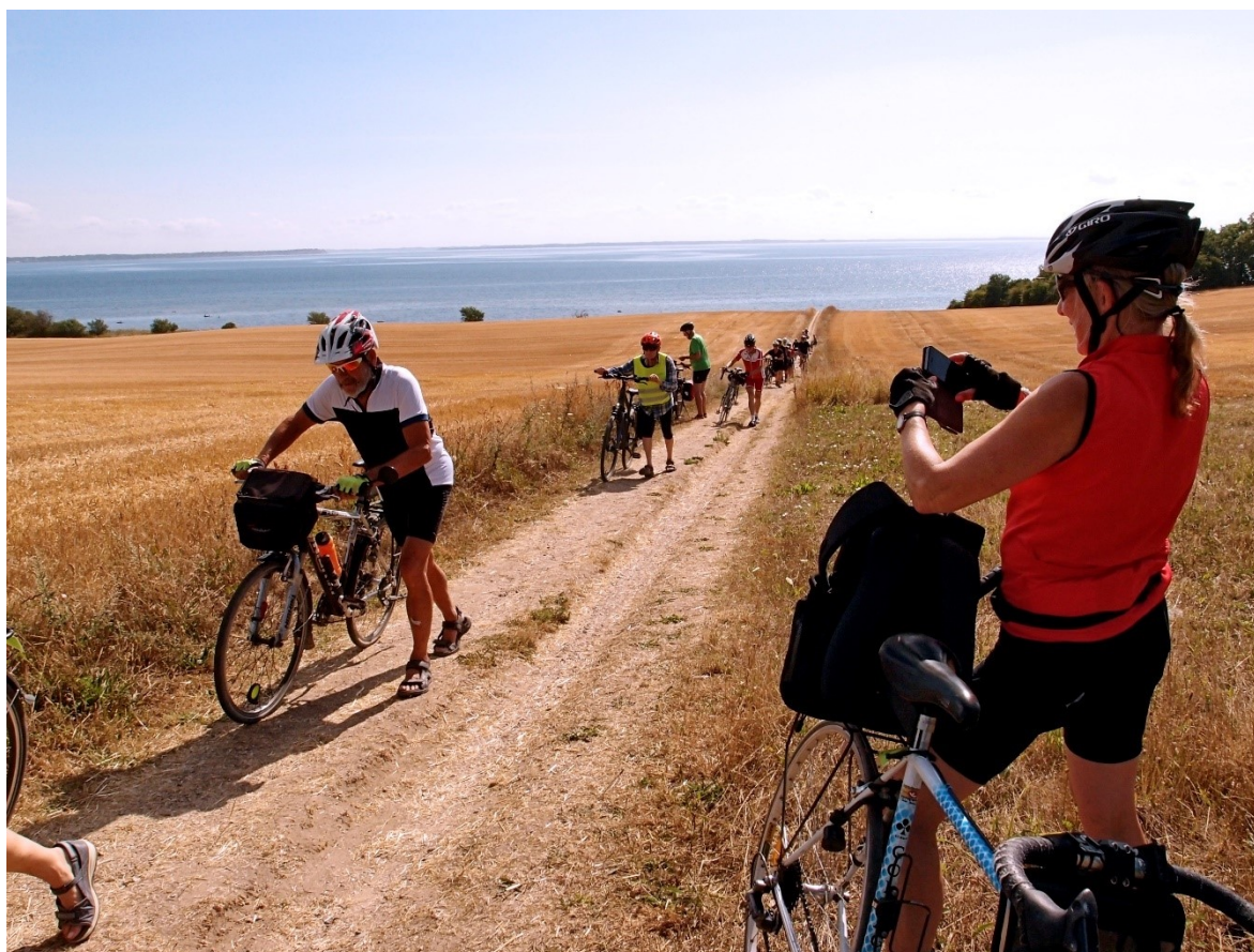
Når modstanden når en vis størrelse, må man trække. (fra Frederiksværk 2018)