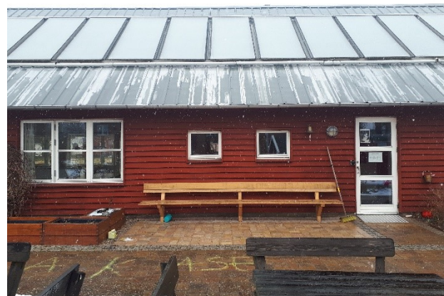
Optimistturen: Bænken venter på de kaffetørstige cyklister

Begge ture har kaffe/kagested på Munksøgård ved Marbjerg. Derefter går turen ind ad Roskildevej til Ringvejskryd- set i Glostrup.