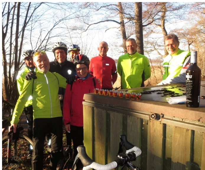
Pause på vintertræningen

Det er også tanken, at der godt må holdes en pause undervejs, hvor udsigten over Øresund eller hvad der måtte vise sig kan nydes og medbragt drikke og kiks/bar/frugt kan indtages.