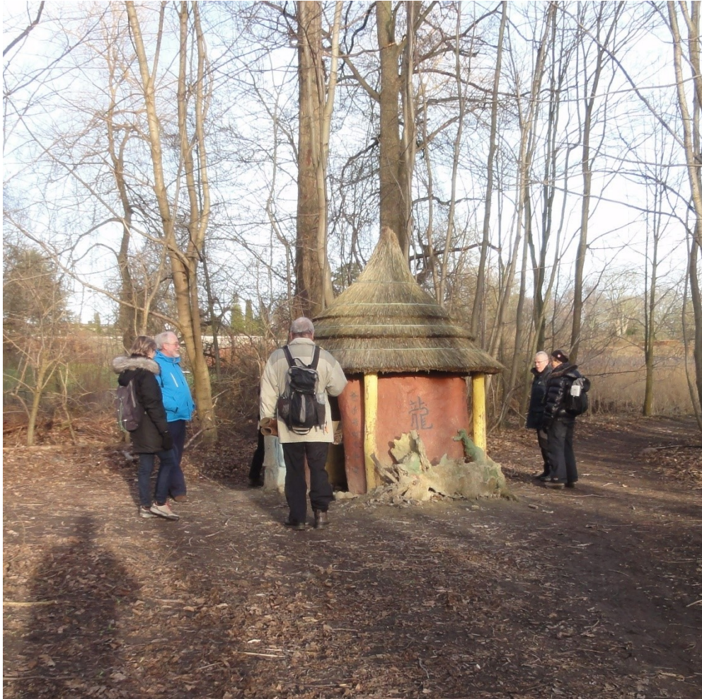
Vandretur i januar: Farum sø rundt