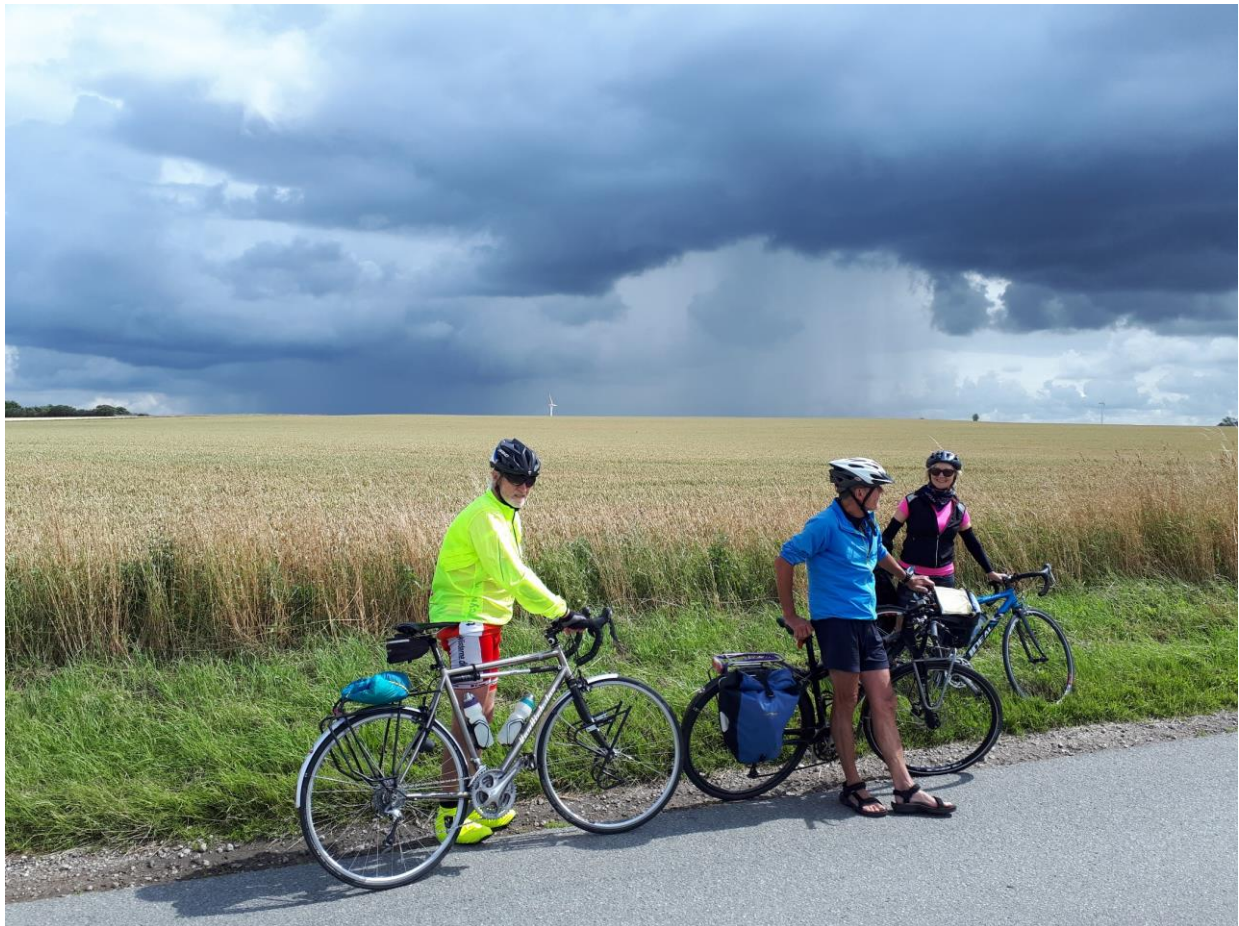
Fra Cykelturistugen 2017 i Holstebro