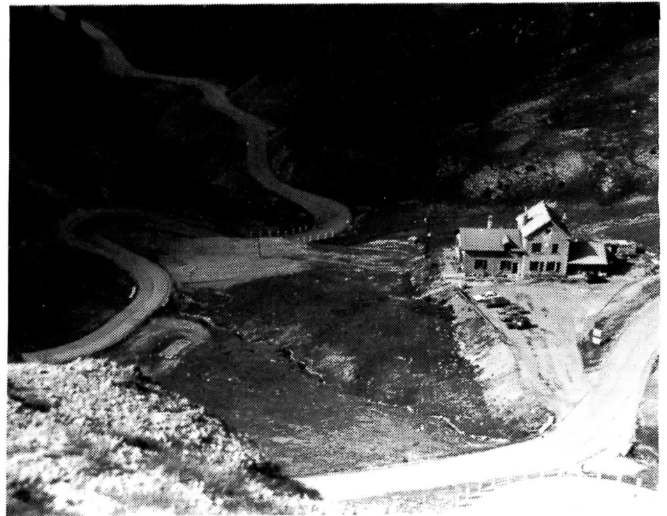
Kig ned over Route Napoleon.