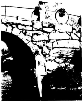
Dansk Cyklist Forbund-Turistudvalget

PÅ CYKELFERIE I DANMARK -en brochure for udlændinge