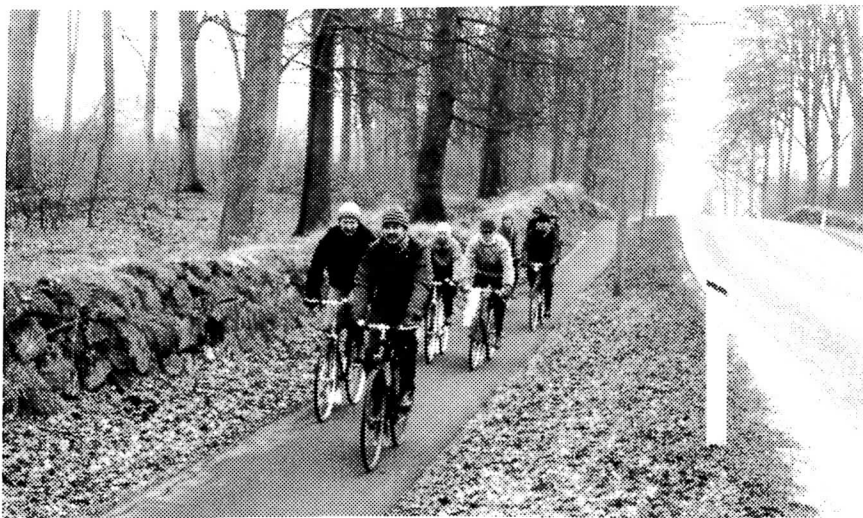
På vej mod Kalkgården på årets første (lidt) længere tur.