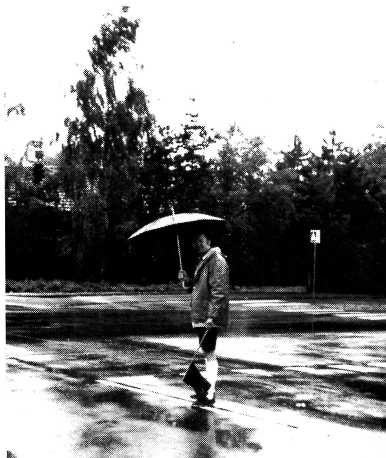
Kontaktpost 15 SJÆLSØ RUNDT '82.