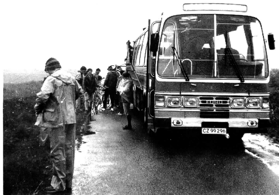
Starten på Sydsjællandsturen v/Farø-kroen.