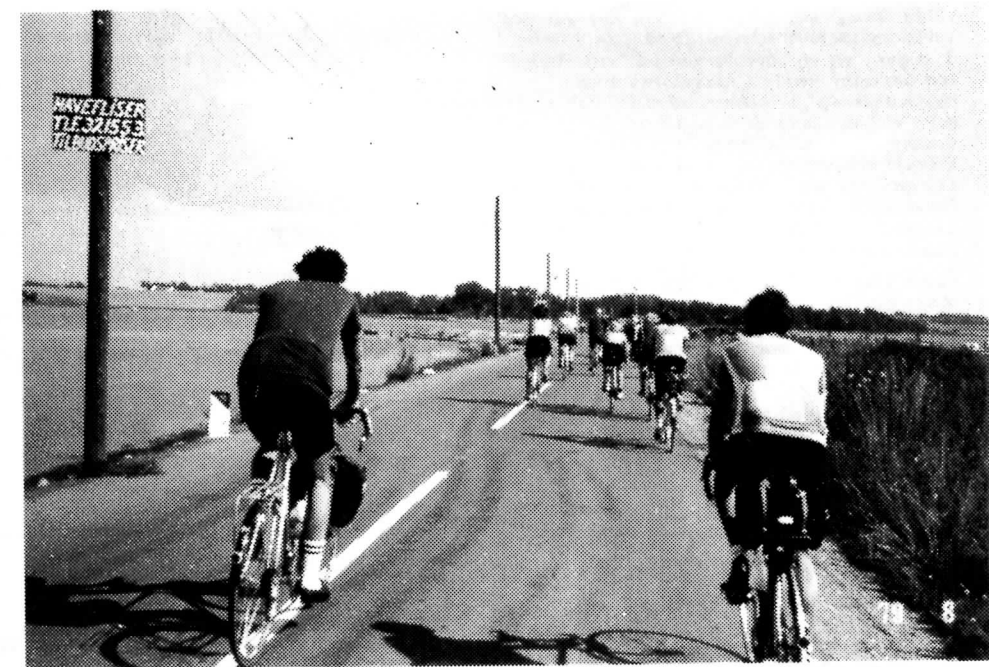
Fra en af sommerens ture (Orø)

Avedøre Tværvej 15 2650 Hvidovre Tlf. 49 46 70