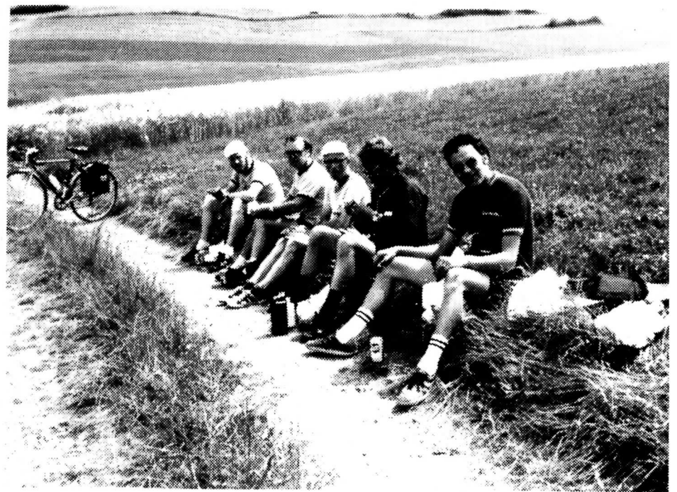
På AIT-rally i Luxembourg